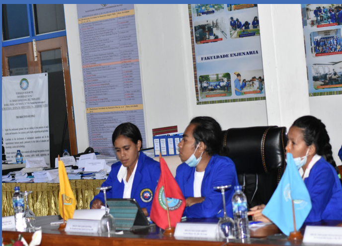
Partisipasaun entudante sira iha prosesu Avaliasaun no Akreditasaun Instituional iha UNPAZ-2021

Hare ba kontektu Timor-Leste nudar nasaun foun no foin hahú prosesu akreditasaun iha nível ensinu superior nian, governu desidi atu hahú uluk akreditasaun instituional hanesan prosesu inisial ida atu regulariza instituisaun lubun ida ne'ebé harii tiha ona ho programa estudu ne'ebé la' o tiha ona ho número estudante ne'ebé barak.