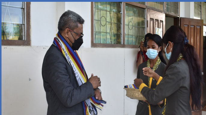
Diretór Ezekutivu visita no akompanha avaliador nasional sira hala'ò avaliasaun akreditasaun instituisional iha Instituto Profissional de Canossa (IPDC)-2021

(Hakerek husi: Sra. Dirce Belo (Ofisial Kualidade))