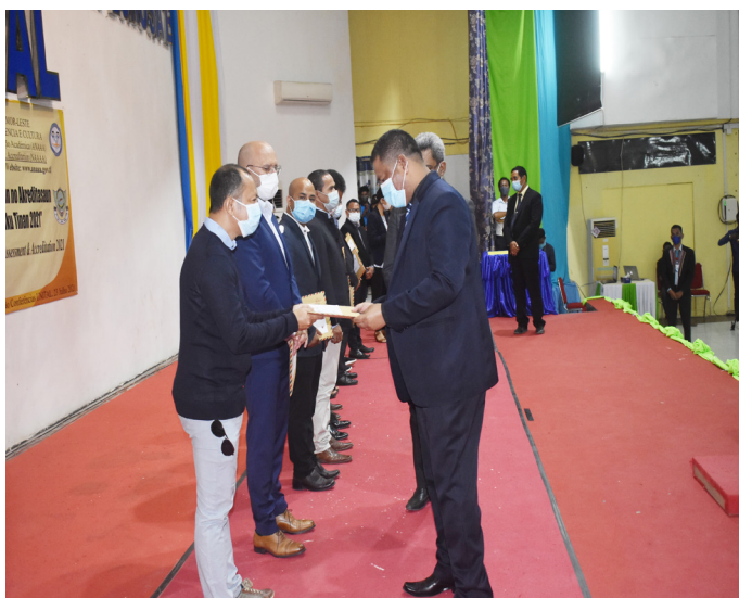
Sua Excelência Ministro Ensino Superior, Ciência e Cultura simbolicamente entrega relatório auto-avaliação HUSI IES ba avaliador nasional tinan 2021