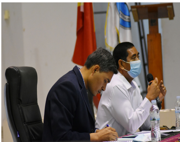
Presidenti no Sekretáriu presidi enkontru Konsellu Direтиву ANAAA