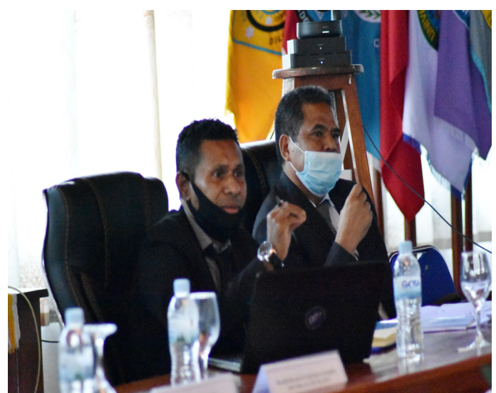
Avaliador nasional sira hala'o visita avaliasaun no akreditasaun programa/siklu de estudu iha Universidade da Paz (UNPAZ) tinan 2021