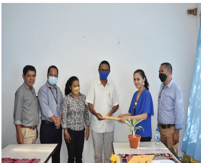
Avaliador nasional husi ANAAA entrega relatóriu avaliasaun no akreditasaun programa/siklu estudu ba Universidade Nacional Timor Lorosa'e (UNTL) tinan 2021