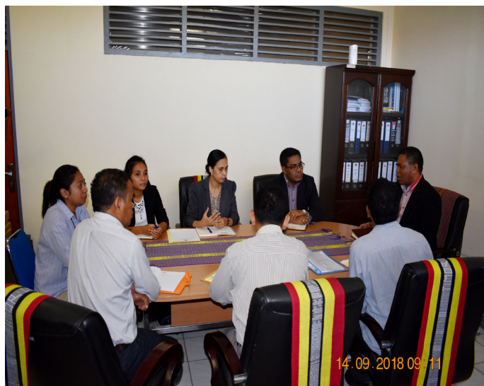
Diretór ezekutivu no ekipa ANAAA partisipa eskontru ho Sua. Excelência Ministro iha gabinete Ministériu Ensinu Superior, Ciênciia e Cultura tinan 2018