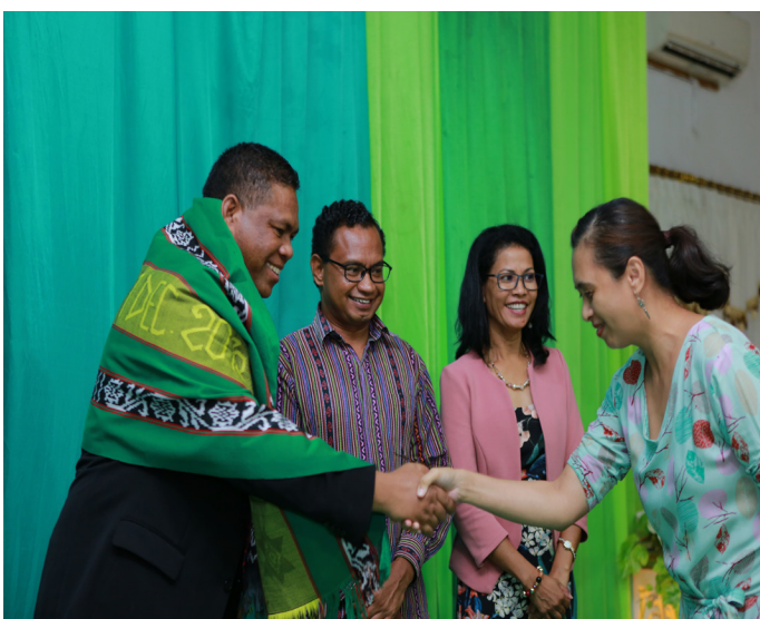
Ofisial Kualidade husi ANAAA tara tais ba Sua Excelência MESCC iha eventu “Seminário Dia Nacional do Ensino Superior” tinan 2020