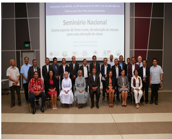
Foto hamutuk Diretór Ezekutivu ANAAA ho estrutura IES sira iha “Seminário Dia Nacional do Ensino Superior” tinan-2020