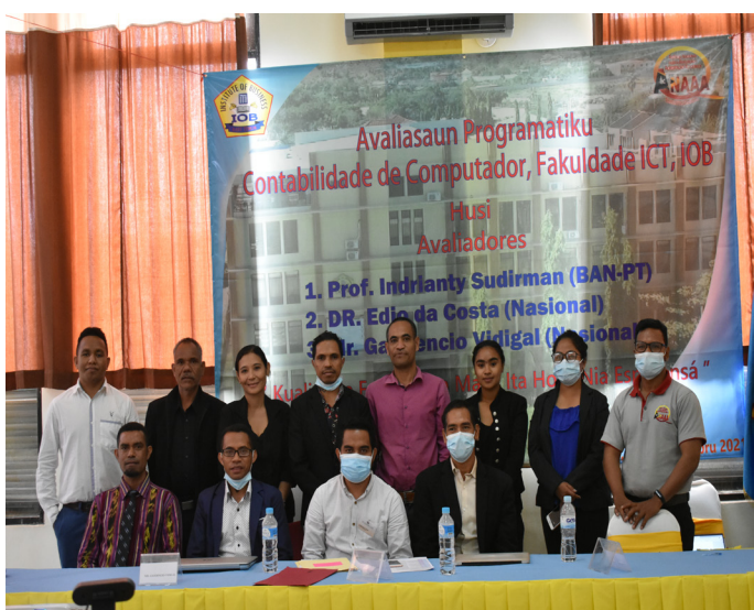
Foto hamutuk avaliador nasional no estrutura husi Faculdade ICT iha Institute of Business (IOB) tinan 2021