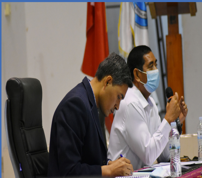
Enkontru ordináriu Konsellu Diretivu ANAAA iha salaun Ian Martin, INFORDEPE-2021

nasaun nian liu hosi inovasaun iha siensia no teknolojia.