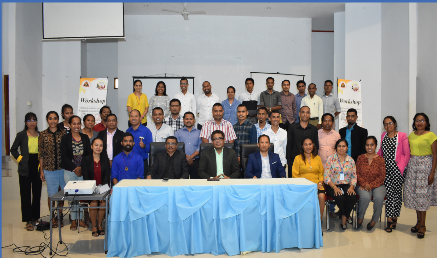
Foto hamutuk iha formasaun IQA ne'êbe maka organiza husi ANAAAA no hetan partisipasaun masimu husi IQA Institúisaun Ensину Superior sira.