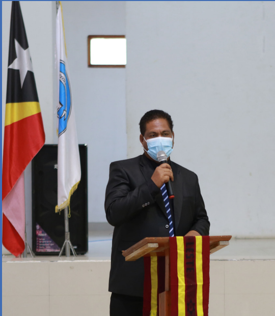
Diskursu husi Sua Exelénçia Ministro Ensino Superior Siénsia no Cultura (MESSC) tinan 2020

W orkshop Nasional ho tema “Reforza Sistema Garantia Kualidade Ensino Superior” hala’o durante loron rua iha salaun IAN-Martin-Infordepe, Balide, Dili, Timor-Leste iha loron segunda-terça feira, loron 24-25 fulan agostu tinan-2020.