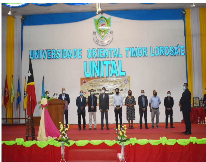
Lansamentu ba programa akreditasaun programatiku/siklu estudu ba tinan 2021 husi Sua Excelência Ministro Ensino Superior, Ciência e Cultura tinan 2021.