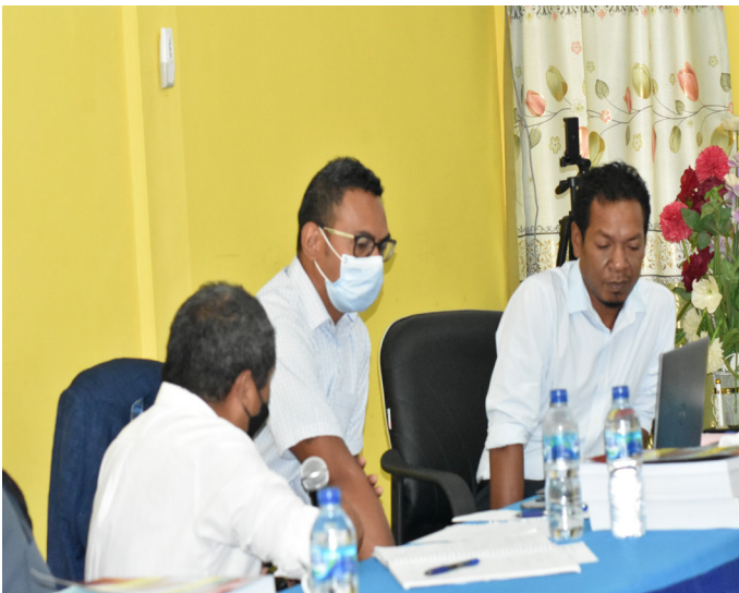
Avaliador nasional sira hala'o visita avaliasaun no akreditasaun programa/siklu de estudu iha Universidade Timor Lorosa'e (UNITAL) tinan 2021