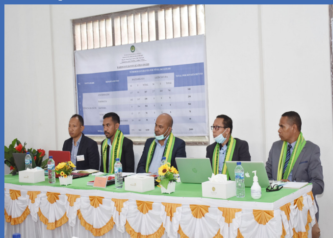
Prosesu Avaliasaun no Akreditasaun Instituional iha Instituto Ciências de Saude (ICS)-2019

e. Akreditasaun instituional tinan-2013 (UNDIL, UNITAL no ETCI) ETCI: ETCI hari'i dahuluk hanesan East Timor Coffee Academy (ETICA ho área konsentrasaun iha agrikultura. Ho estabelesimentu ba kursu inisial hirak ne'e, ETICA haka'at ba akreditasaun instituional iha tinan-2008 no hatudu rezultadu di'ak tebes. Rezultadu akreditasaun hatudu katak ETICA hetan valor 100% no kumpre ba kritériu 8 husi padraun ba akreditasaun instituional iha momentu ne'ebá. Iha tinan-2013, ETICA hato'o pedidu ba Ministériu Edukasaun no ANAAA hodi upgrade ninia estatutu husi Akademia ba Institutu Ensinu Superior. Hatán ba pedidu iha ne'e, iha tinan-2013 ANAAA hala' o