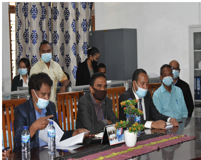
Estrutura husi Instituto Superior Cristal participa iha prosesu avaliasaun ba akreditasaun programa/siklu estudu husi ANAAA tinan 2021