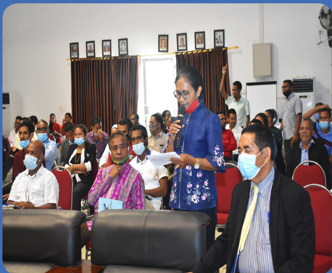
Representante husi IES hatoò perguntas iha sesaun perguntas no resposta durante formasaun IQA iha salaun IAN-Martin, Infordepe-Balide-2021

gresu ba nia a'an. Qualidade sira ne'ebé p'ritos sira halo ba institúisaun sira ne'ê baseia liu ba fitness of / for propose, exemplo, visaun misaun institúisaun nian ne'ê fit ho asaun iha ensinu superior ida ka lae?. Nia mós hatutan tan katak, Internal Quality Assurance (IQA) ne'ê kompromisu estrútura institúisaun tomak nian hodi garante qualidade interna.