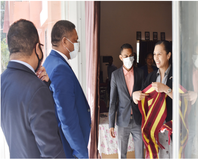
Sua. Exelénsia Ministru do Ensinu Superior, Ciéncia e Cultura partisipa serimonia tomada de pose Presidente eleito KD-ANAAA no membru sira periodo 2021-2023