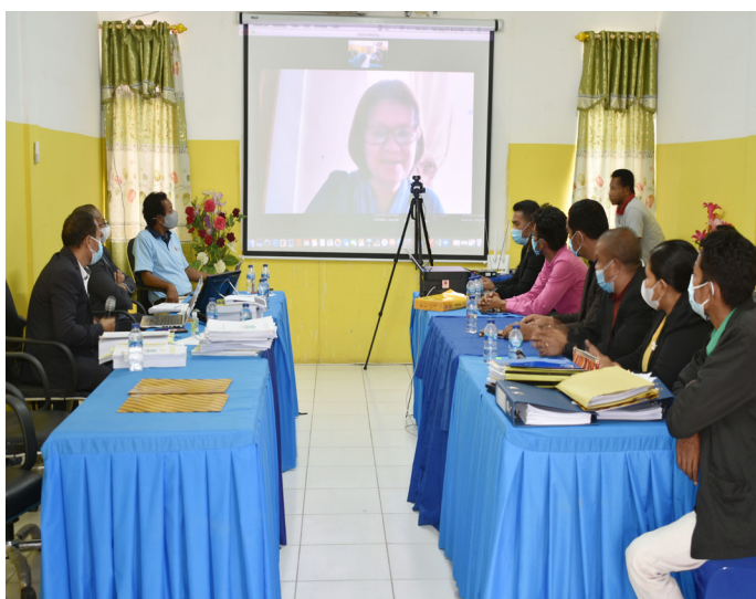
Avaliador nasional no internasional sira hala'o visita avaliasaun no akreditasaun ba programa/siklu de estudu iha Universidade Oriental Timor Lorosa'e (UNITAL) tinan 2021