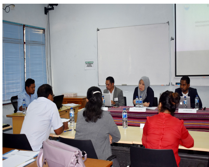
Avaliador nasional no internasional hala'o visita avaliação ba akreditasiun programa/siklu de estudo iha Universidade Nasional Timor Lorosa'e (UNTL) tinan 2018