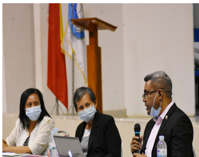
Intervensaun husi Diretor Ezekevitu iha enkontru Konsellu Direтиву ANAAA