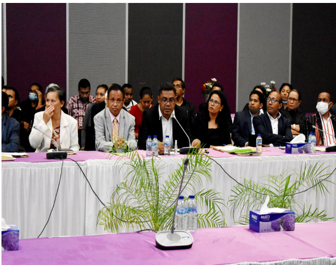
Diretór Ezekutivu partisipa iha apresentasaun orsamentu jeral iha Ministériu Finansas tinan 2019