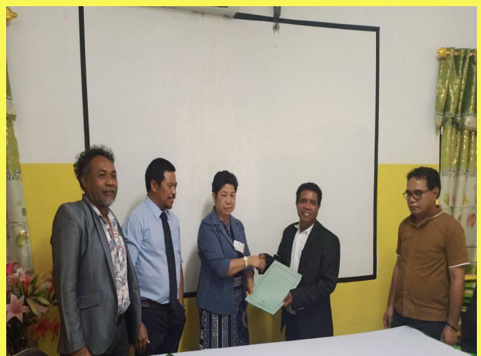
Vizita avaliasaun ba akreditasaun programatika iha Universidade Oriental Timor Lorosa'e (UNITAL) tinan-2019

Although the private university has clear general directions set for its future, the roadmaps are loosely framed for the different levels of the hierarchy. The agenda, thrusts, and priorities for specific mandates need setting particularly on instruction, research, community engagement, faculty capacity development, academic resources development, and student development. Middle level leadership and management need to be strengthened, and so are faculty capacity and competence. This is an outcome of a very slim staffing pattern and the HEI being largely dependent on part-timers. While there is nothing wrong with part-timers especially if they are industry practitioners, it becomes a deterrent if their number exceeds