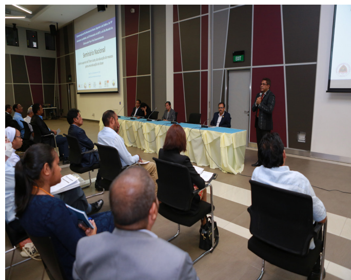
Apresentasaun husi Diretór Ezekutivu iha “Seminário Dia Nacional do Ensino Superior” ne’ebé hala’o iha Ministériu Finansas tinan 2020