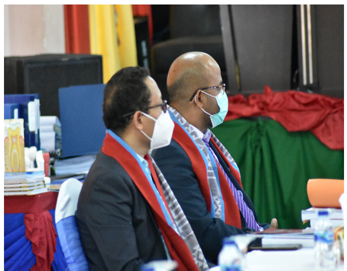
Avaliador nasional sira hala'o visita avaliasaun no akreditasaun programa/siklu de estudu iha Universidade de Dili (UNDIL) tinan 2021