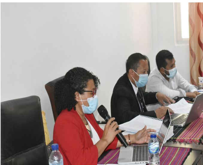
Avaliador nasional sira hala'o visita avaliasaun no akreditasaun programa/siklu de estudu iha Instituto Superior Cristal (ISC) tinan 2021