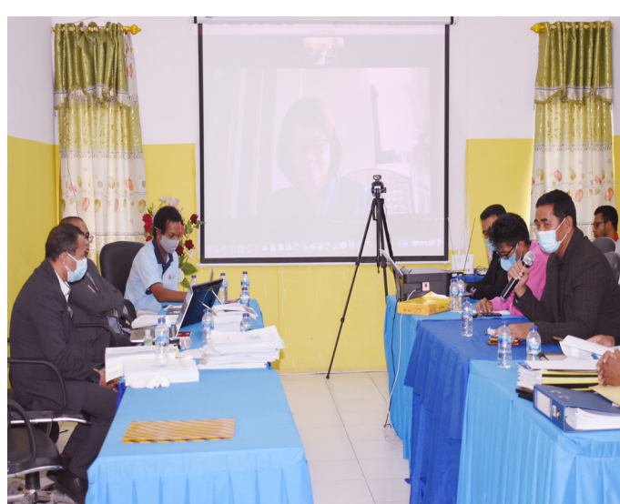
Avaliador nasional no internasional hala'o visita avaliação ba akreditasiun programa/siklu de estudo iha Universidade Oriental Timor Lorosa'e (UNITAL) tinan 2021