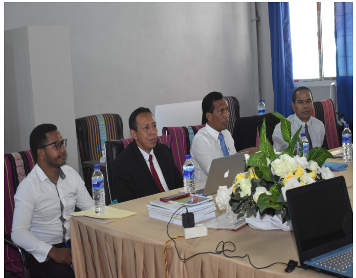
Avaliador nasional sira hala'o visita avaliasaun ba rejistu kursu mestrado iha Instituto Superior Cristal (ISC) tinan 2021