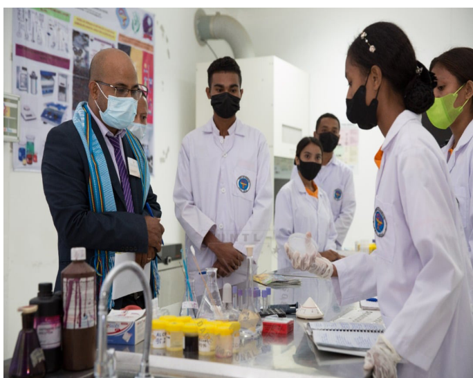
Prosesu visita avaliação hodi hare kondisaun laboratorium iha Universidade Nasional Timor Lorosa'e (UNTL) tinan 2021