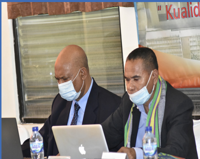
Prosesu avaliasaun no akreditasaun instituional iha Institute of Business (IOB)-2021