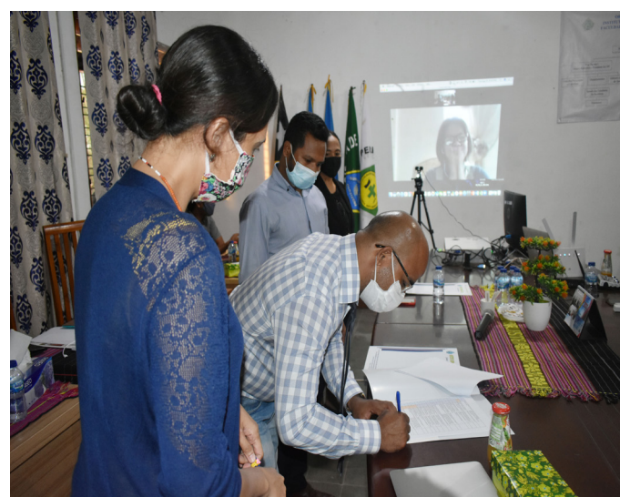
Avaliador nasional no internasional sira hala'o visita avaliação no akreditasiun ba programa/siklu de estudo iha Instituto Superior Cristal (ISC) tinan 2021