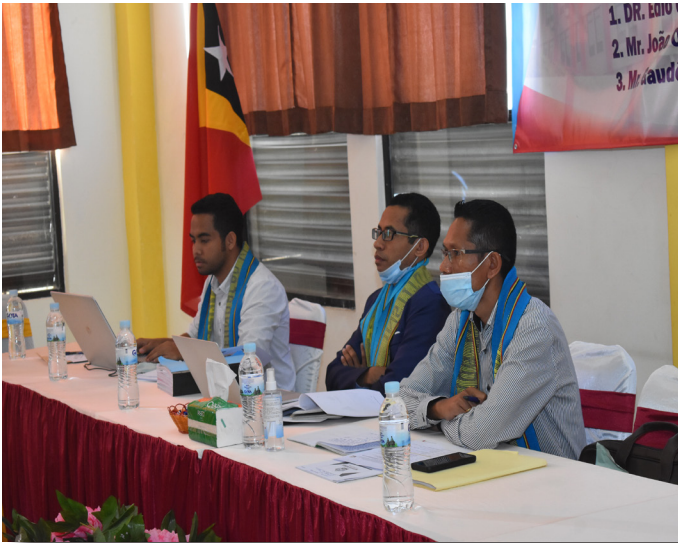
Avaliador nasional sira hala'o visita avaliasaun no akreditasaun programa/siklu de estudu iha Institute of Business (IOB) tinan 2021