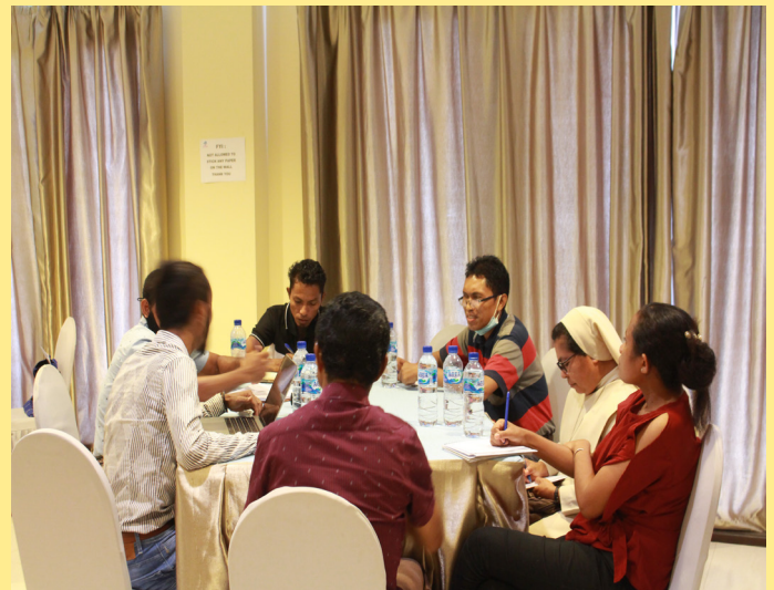
Grupo diskusaun iha formasaun IQA