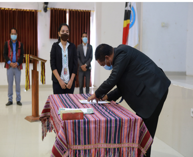
Aprovasaun ba akta tomada de pose husi Sua Excelénsia Ministro Ensinu Superior, Ciéncia e Cultura.