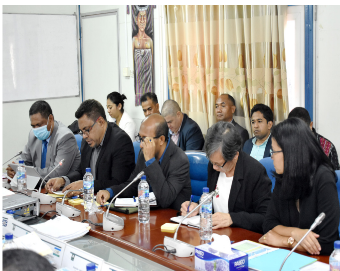
Diretór Ezekutivu partisipa Audénsia Publika iha Komisaun G Parlamentu Nasional no akompanha husi Sua Excelência Min-istru Ensinu Superior, Ciênciia e Cultura (MESCC) tinan 2019