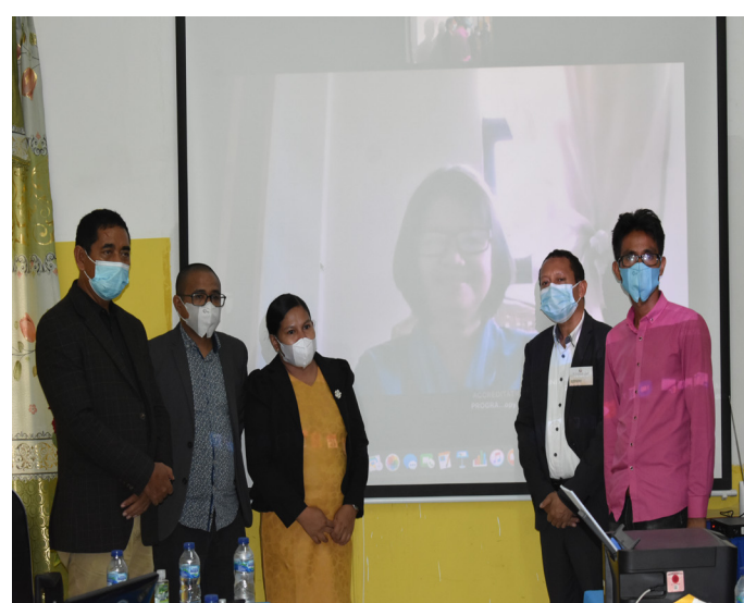
Foto hamutuk bainhira remata visita avaliasaun no akreditasaun ba programa/siklu de estudu iha Universidade Oriental Timor Lorosa'e (UNITAL) tinan 2021