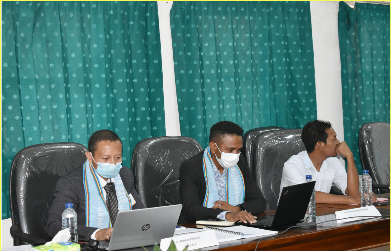
Prosesu Avaliasaun iha Universidade Nasional Timor Lorosa'e (UNTL)-2021