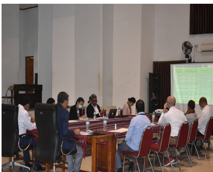
Enkontru ne'ebé lidera husi Presidenti Konsellu Direтиву no hetan partisipasaun masimu husi membru sira.