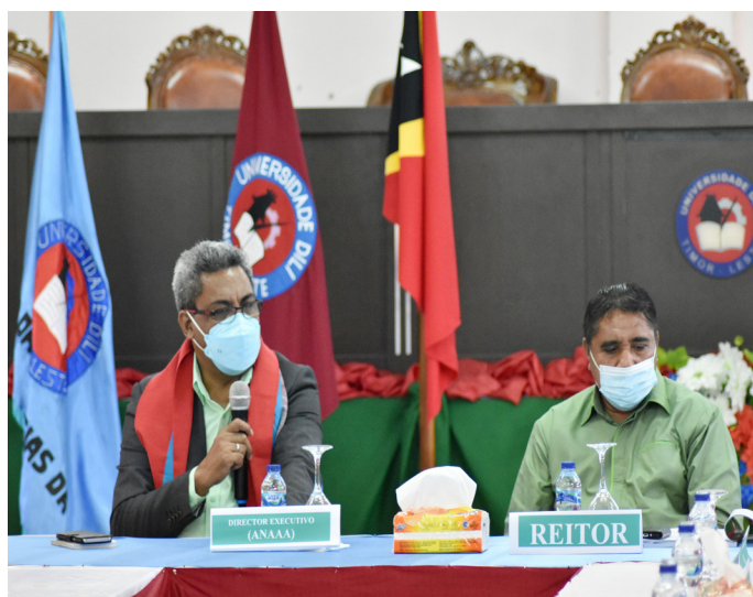
Introdusaun husi Diretór Ezekutivu iha prosesu avaliasaun ba akreditasaun programa/siklu de estudu iha Universidade de Dili (UNDIL) tinan 2021